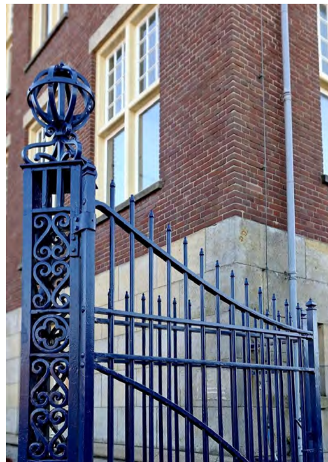
Fragment van het smeedijzeren hekwerk geschilderd in de oorspronkelijke kleur

geschikt gemaakt voor bijzondere bijeenkomsten. Zo krijgt het Grootte Kantoor op termijn zijn statige uitstraling en voormalige functie terug, en heeft Delft er weer een prachtig visitekaartje bij.