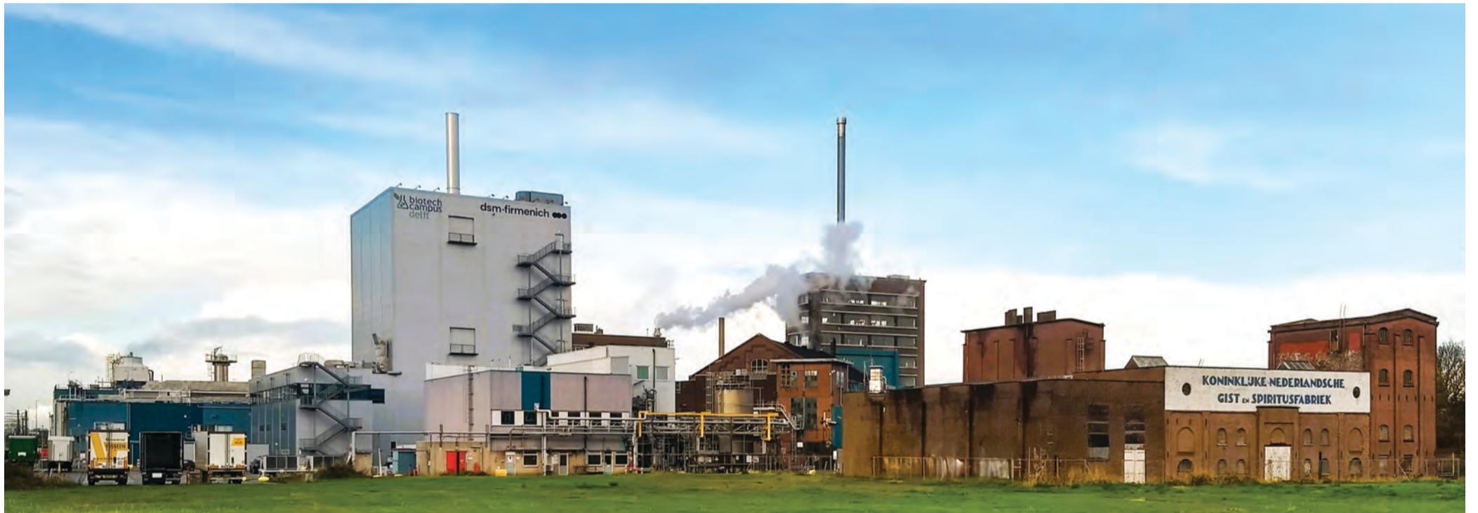
Het Gist Productie Bedrijf tijdens haar laatste dagen in bedrijf

In juni 2024 maakte dsm-firmenich bekend de activiteiten op het gebied van gistextracten te gaan verkopen aan het Franse Lesaffre. Eind december 2025 sloten daardoor de deuren van het Gist Productie Bedrijf. Daarmee is er een einde gekomen aan de gistproductie op de Biotech Campus Delft.